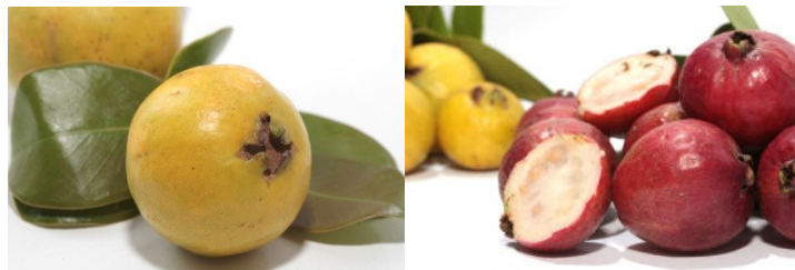
Figura 1. Araçá amarelo e vermelho.

Os polifenóis, muito presentes em folhas e frutos nativos, podem estar diretamente relacionados com a atividade antimicrobiana presente no araçá. Isso ocorre provavelmente devido à capacidade dos compostos fenólicos formar complexos com íons metálicos ou reagirem com a membrana celular e inativar enzimas essenciais, limitando sua disponibilidade ao metabolismo microbiano. Extratos de araçá se mostraram eficientes para Streptococcus mutans , principal bactéria causadora da cárie dental e Salmonella Enteritidis , grande causadora de toxiinfecções em seres humanos (Crivelaro de Meneses et al., 2010; Medina et al., 2011).